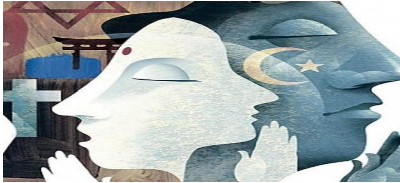
Şekil 1.1. Medeniyetler çatışması (Kay. www.medyalens.com)

Küreselleşme ile ilgili tartışmaların en önemlilerinden biri, ulus devletin içerisine düştüğü krizdir.